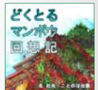
koton-0269 4枚組 10,500円

本書は、日本経済新聞に『私の履歴書』として連載されたも のに加筆修正したものである。文学への目覚め、執筆開始、 躁とウツ、父と母妻と娘、先輩や友人、歳晩に思うこと・・・ 大河ドラマの総集編を見るような趣のある一冊である。