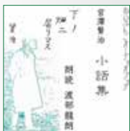
koton-0168 3 枚組 5,250 円

宮澤賢治の世界を追求する朗読家、渡部龍朗が渾身の想いを こめて読みました。独自の作品解釈と世界観が、朗読世界を 裏打ちし、充実のしあがりとなっています。 収録作品:「雁の童子」「手紙」「毒もみのすきな署長さん」「ガ ドルフの百合」「畑のヘリ」「シグナルとシグナレス」「よく利 く薬とえらい薬」