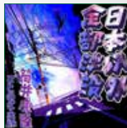
koton-0263 1枚組 3,150円

小松左京の長編小説「日本沈没」のパロディとして有名で、 小松左京氏公認のパロディ小説。しかし、中身は日本人の島 国根性の浅ましさを露骨に書いたブラックユーモア小説であ る小松左京の長編小説『日本沈没』も映画化されたが、この 日本以外全部沈没も、2006年に映画化された。