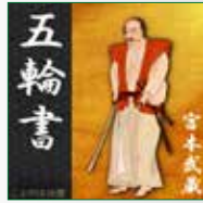
koton-0288 3枚組 6,300円

「命がけの実利主義」ともいわれる剣豪・宮本武蔵の兵法。彼は、人生の最末期、熊本にある洞窟内にこもり命を削るようして『五輪書』を書かれたと言われています。いわば後の世にむけての武蔵の遺言の書ともいえるその一書を、今、まさに脂の乗ってきた朗読家・渡部龍朗が、剣豪と真剣でわたりあう気迫で読みあげました。