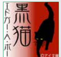
koton-0187 1枚組 2,100円

エドガー・アラン・ポーといえば江戸川乱歩がペンネームの 由来にしたというほど、推理小説の祖とされていますが、今 回の作品「黒猫」は同じミステリーのジャンルでも日本語に すれば怪奇小説に分類されます。怪奇小説といっても妖怪や 幽霊が出てくるホラーなどではなく、自分の内面が壊れてい く様を淡々と独白調で書かれた作品です。