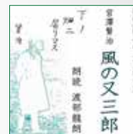
koton-0169 4 枚組 5,250 円

まさに決定版ともいえる「風の又三郎」ができあがりました。 二学期の始業式の日、学校にやってくると教室に見知らぬ赤 毛の男の子がいました。子どもたちはその子を「風の又三郎」 と思い込み、それからおよそ十日間、一緒に山や谷を遊びま わります。風の又三郎の先駆作品風の精のSF的冒険談であ る「風野又三郎」も同時収録