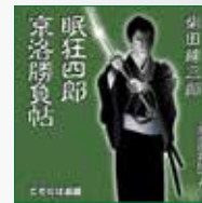
koton-0037 2枚組 4,200円

時代小説のヒーロー-眠狂四郎がオーディオブックで登場です。八方破れの無類者、眠狂四郎が京都を舞台に大活躍します。絶妙のストーリー展開を俳優 後藤敦が好演。最後の最後まで飽きさせないオーディオブックに仕上がりました。