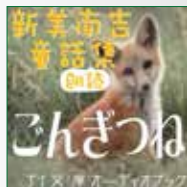
koton-0155 1 枚組 2,100 円

秋茜による新美南吉の童話シリーズ。 『デンデムシノカナシミ』『赤いろうそく』『ごんぎつね』… の、3作品を収録しました。 あくまでヒトの視線で 自分の周囲の生活の中から拾い上げた素朴なエピソードを、 脚色したり膨らませたりした、素朴で味わい深い作風です。