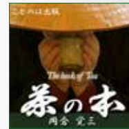
koton-0261 6枚組 6,300円

日本人なら一度は読むべき、日本の心「茶の本」(岡倉天心)がオーディオブックでついに発刊。日本を含むアジアが欧米から見下されていた前世紀初頭、東洋の意気込みや素晴らしさを知らしめるために、岡倉寛三(天心)がボストンにおいて英語で執筆した本で、原文は英語で書かれています。