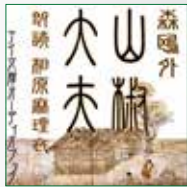
koton-0010 2 枚組 2,940 円

父の任地へ向かう、頼りなげな母と子二人と女中の一行。行 き暮れ疲れた彼らの隙につけいったのは、恐ろしい人買いた ちだった。母と引き離され山椒大夫に売り飛ばされた安寿と 厨子王は過酷な毎日を強いられる。いつか父母に会える日が くることを祈りながら耐える二人だったが……。