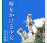
koton-0262 3枚組 5,250円

人生をリセットしたい、と思ったことは誰しもあるのではな いでしょうか。しかし、ゲームをリセットして、さっきの方 がよかったかも、と思ったことのある人も多いでしょう。「リ セットした人生」「リセットしなかった人生」 ・・・結局、人がたどれる道は、一筋きりなのです。