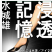
koton-0297 11枚組 8,400円

携帯公式サイト「どこでも読書」で配信され、数ある人気作・ 有名作家の作品をおさえコースランキング1位を独走し続け たSFサスペンス小説