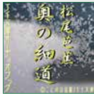
koton-0142 1枚組 2,100円

有名な古典を名古屋地方を中心に活動されているトップクラスのナレーター、榊原忠美氏が圧倒する表現力で「おくのほそ道」(奥の細道)を朗読。「夏草や 兵(つはもの)どもが夢のあと」「閑さや岩にしみ入蟬の声」「五月雨を あつめて 早し 最上川」…松尾芭蕉の俳句、いくつ覚えていますか？