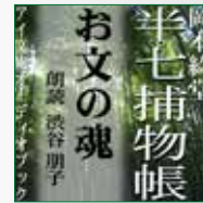
koton-0242 1枚組 2,100円

幼い娘は何に怯えて泣くのか…… 理由を知っているはずの嫁は黙して語らず、里に帰りがたるばかり。謎の裏に秘められた策謀を、半七親分の鋭い観察眼が抉り出す……。 幕末の江戸を舞台に、人情にや篤いがクールな知性派、半七親分が大活躍！