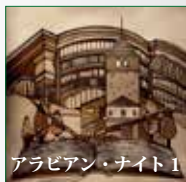
アラビアン・ナイト 1