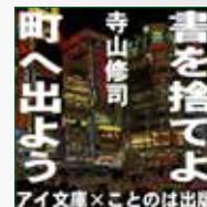
koton-0357 7 枚組 12,600 円

詩人、歌人、俳人、エッセイスト、小説家、評論家、映画監督、 俳優、作詞家、写真家、劇作家、演出家……本業を問われ ると「僕の職業は寺山修司です」とかえすのが常だった。ひ とりの男が「生きる実感」を求めてあがいた軌跡を表現する ため、7人の朗読家が結集。カルメンマキ / 唐沢龍之介 / 榎 原忠美 / 窪田涼子 / 春日玲 / 野々宮卯紗 / 守屋玲子