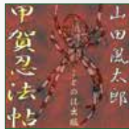
koton-0044 10枚組 6,300円

傑作忍小説「甲賀忍法帖」がオーディオブックになりました。悲運の恋人たち、常識をはるかに超えた体質と能力から生まれる奇抜な術、そして無敵を誇ってきた忍者たちの非情な殺人トーナメント。独創的なアイデアがふんだんに盛り込まれた忍小説の傑作です。野々宮卯妙の時代がかかった古めかしい朗読が、おどろおどろしさを漂わせます。