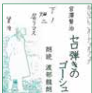
koton-0170 3 枚組 5,250 円

宮澤賢治の世界を追求する朗読家、渡部龍朗が渾身の想いを こめて読みました。独自の作品解釈と世界観が、朗読世界を 裏打ちし、充実の仕上がりとなっています。 表題作『セロ弾きのゴーシュ』他短編佳作4作を収録。