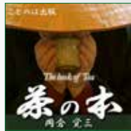
koton-0194 3枚組 3,150円

日本人なら一度は読むべき、日本の心「茶の本」(岡倉天心)がオーディオブックでついに発刊。日本を含むアジアが欧米から見下されていた前世紀初頭、東洋の意気込みや素晴らしさを知らしめるために、岡倉寛三(天心)がボストンにおいて英語で執筆した本で、原文は英語で書かれています。