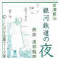
koton-0205 3 枚組 6,250 円

「どなたか、ポーセがほんたうにどうなつたか、知っているか たはありますか。…」妹トシを喪ったとき賢治が記した一 文です。このふるい物語がこんなにもせまってくるのは、 源にあったものが、この万人が一生のうちに一度は持つだろ う疑問であったからかもしれません。 そして、このうつくしいものがたりが未完で終わったのも。