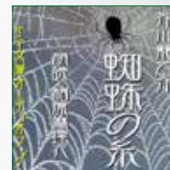
koton-0295 1 枚組 2,100 円

地獄に落ちたカンダタにお釈迦様から救いの細い蜘蛛の糸が ……教科書でおなじみの方もおられるでしょう表題作「蜘蛛 の糸」ほか、「蜜柑」「鼻」——の、全三編。 人間のエゴイズムを端的にえぐっており、それは小学生でも 理解できるであろう明快さと、大人となったものにも読ませ る深さがあります。