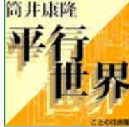
koton-0148 1枚組 2,100円

「平行世界」がオーディオブックになりました。 「ずっとずっと上の方のおれなんだってさ。 どれくらい上かというと、それはもうずっと上で、だいたい 二百五十か二百六十ぐらい上の人だそうだ・・・」 頭がこんがらがってくる平行世界を「最後の喫煙者」でオー ディオブック初作品を会心の読みで披露