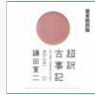
koton-0963 2枚組 2,100円

1300年前、稗田阿礼が語り、太安万侶が聞き書きした、ふることぶみの神がたり 古事記ルネサンス運動を展開する著者、鎌田東二の神がたり、じっくりお聞きください。