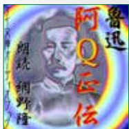
koton-0343 3 枚組 2,100 円

ある日、平穏な日をおくる阿Qのもとに革命軍がやってきて 無実の罪で拘束され、ひどい目に遭う。そこから阿Qに不幸 と運が次々と……。愚かだが罪のない人間に向けられる、 辛辣ではあるがあくまで人間愛を貫く著者のまなざしは、同 時に革命という大きな社会変動への鋭い批判の視線ともなっ ている。近代中国文学の巨人、魯迅の代表作。