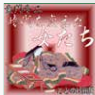
koton-0069 2枚組 5,250円

歴史の節目節目に登場した女性にスポットをあてた小説です。著者はあつぎの中で「時代を変えた女たち」というタイトルの別な意味は、「平和を願った女性たち」と言い換えることができるだろう。と述べています。歴史の教科書で記憶には残っている女性たちを、さらに深く学び、今の時代を考えるのに最適な作品です。