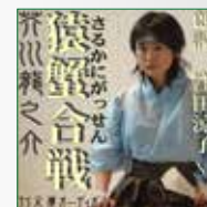
koton-0163 1 枚組 2,100 円

おとぎ話本編の後日譚を、ああでもないこうでもないといひね りながら語り、教訓めいたおとぎ話の意外な側面に嘲笑の視 線を向けるいかにも芥川らしい作品。