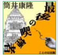
koton-0057 1枚組 2,100円

「健康ファシズムが暴走し、喫煙者が国家的弾圧を受けるよ うになっても、おれは吸い続ける。 地上最後のスモーカーとなった小説家の闘い（文庫裏表紙解 説より）」をミッキーロークの吹き替えや数々のアニメで知 られる俳優、安原義人が会心の朗読を披露。