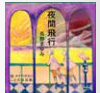
koton-0270 3枚組 5,250円

二人の少年、ミシエルとプラチナ、夏至と冬至の3日前にし か開かない零番窓口、そこでスペシャルな雷卵石を見せると 行くことができる、ハルシオン旅行社のショート・トリップ。