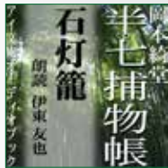
koton-0243 1枚組 2,100円

老舗の娘が昨日から戻らない。 ちらりと家に戻ったとみるや再び行方をくらます。 情人の番頭がからんだのか？ それとも……と探るうち母親が殺された。しかも下手人は行方知れずの娘……？ もつれる謎を十九歳の半七が鮮やかに解く。幕末の江戸を舞台に、人情にや篤いがクールな知性派・半七親分が大活躍！