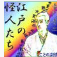
koton-0066 3枚組 5,250円

江戸の怪人たち。鼠小僧次郎吉など江戸時代に活躍した怪人達にスポットをあてた、非常に面白い「怪人列伝」です。今回、その1「義人傑人自由人」の章をオーディオブック化しました。