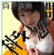
koton-0518 1枚組 2,100円

「問題外科」をオーディオブック化。傑作集の中でも究極の エロ・グロ・ナンセンス度が高いこの作品。夏目漱石「彼 岸過迄」で知られる美人ナレーター窪田涼子がこの問題外科 を非常にうまく読んでいます。