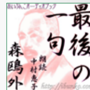
koton-0160 1 枚組 2,100 円

死罪を申し付けられた船乗業柱屋太郎兵衛の娘、16歳のいち は、願い書を書いて弟妹たちとともに奉行所に父の助命を乞 いに行く。「お上の事には間違はございませうから」—— 官僚でもあった文豪の心の綾を垣間見るような佳編。かつて は高校の教科書に採録されていました。