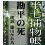
koton-0244 1枚組 2,100円

素人芝居「忠臣蔵」の勘平を演じる大店の息子が…… 本番の真つ最中に殺された！ 半七親分の母に頼まれて捜査に乗り出した半七は、自らも店先で大芝居を打ち、犯人を炙り出す――。 幕末の江戸を舞台に、人情にや篤いがクールな知性派、半七親分が大活躍！