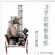
koton-0266 10 枚組 15,750 円

著：筒井康隆 朗読：守屋玲子、唐沢龍之介 他 主人公・唯野仁。彼は若年ながら早治大学英米文学科の名物 教授であり、実は隠れて小説を発表している新進作家である。 しかし、その内幕は！ 総時間 10 時間を超え、プロデューサーも追いつきました！ 10 名を超える朗読者で作り上げた筒井文学の快作です。