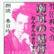
koton-0177 1 枚組 2,100 円

芥川切支丹物の好編。 純粋な娼婦の熱心な崇拜故の美しき誤解——一人の日本 人作家と、不治の病に冒された中国人の少女娼婦の悲恋を 描いた、トニー・オウ監督により映画化もされた作品。他 に“薄明い憂鬱”を描写した「保吉もの」の短編『お時 儀』を収録いたしました。