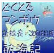
koton-0064 6枚組分 10,500円

マンボウ先生の、世界漫遊5ヶ月間の珍道中。航海中の生活、 アジア、アフリカ、ヨーロッパの寄港地で出くわす事件や珍 事、人々との珍妙なやりとり。思わずふきだすエピソードや、 豊かな教養に裏打ちされた卓抜な文明批評が、マンボウ先生 独特の変な造語やユーモアたっぷりの文章で、縦横無尽に描 き出されます。