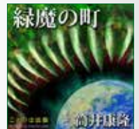
koton-0267 3枚組 6,300円

ヤングアダルトむけ小説とけっして侮ることなかれ！！小 さいころうなされた「何者かが追いかけてくる」夢の怖さのよ うな、かわることのない恐怖にみちた一編。 筒井康隆・ジュブナイル作品のエッセンスが集約された作品 です。